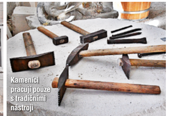
Kameníci pracují pouze s tradičními nástroji