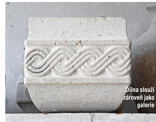
Dílna slouží zároveň jako galerie