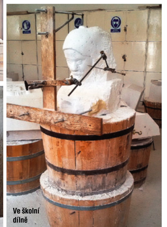
Ve školní dílně

Na kámen musíte umět správně poklepat a také mu naslouchat, tak poznáte, jak moc do něj můžete bouchnout, aby při tom nepraskl.